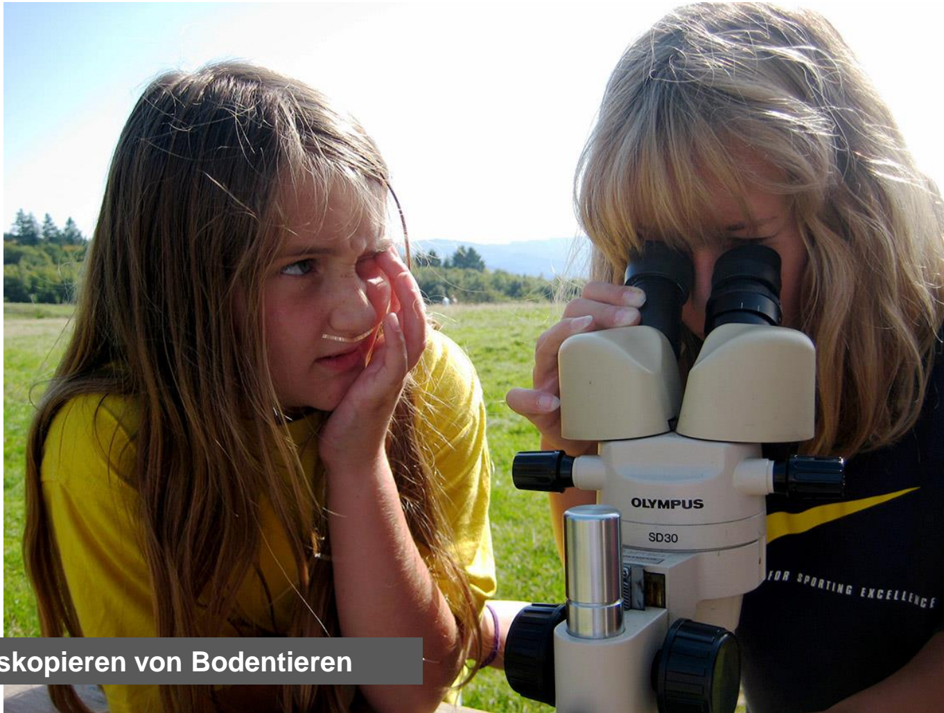
Mikroskopieren von Bodentieren