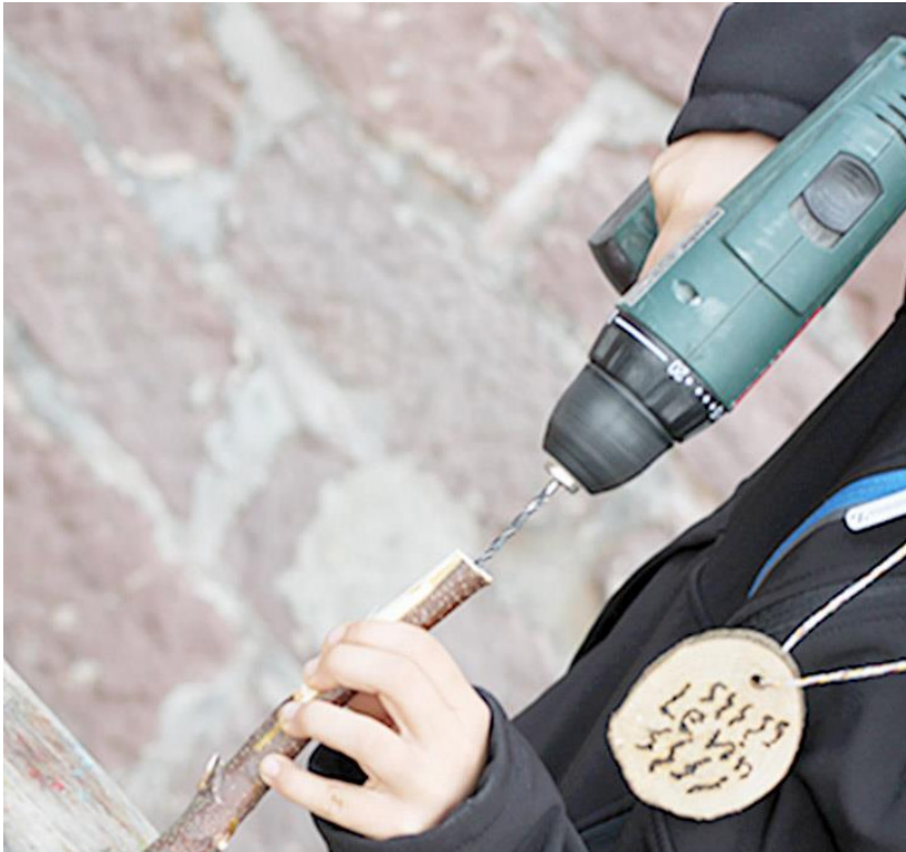
Beispiel: Kugelschreiber schnitzen

Teilkompetenz: Selbstständig planen und handeln können