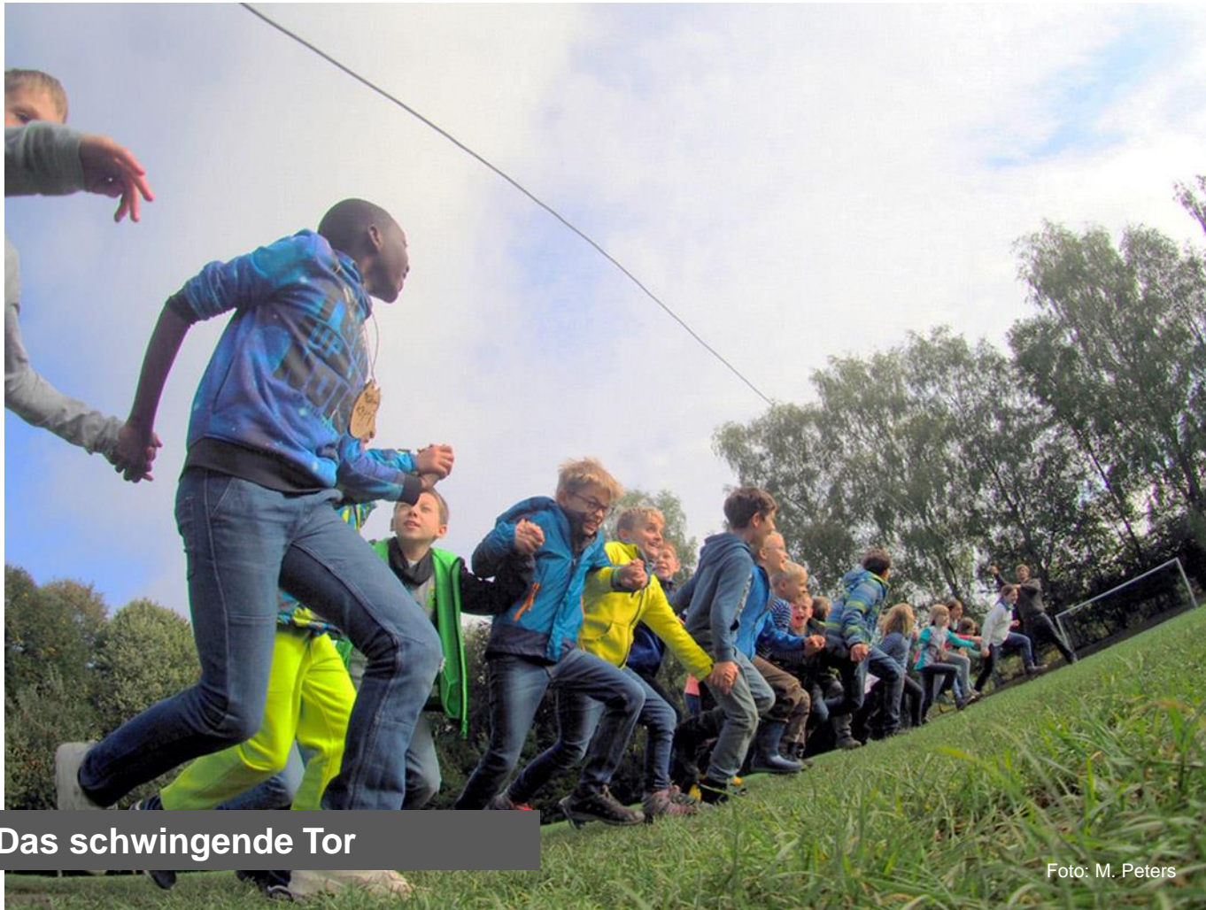
Das schwingende Tor