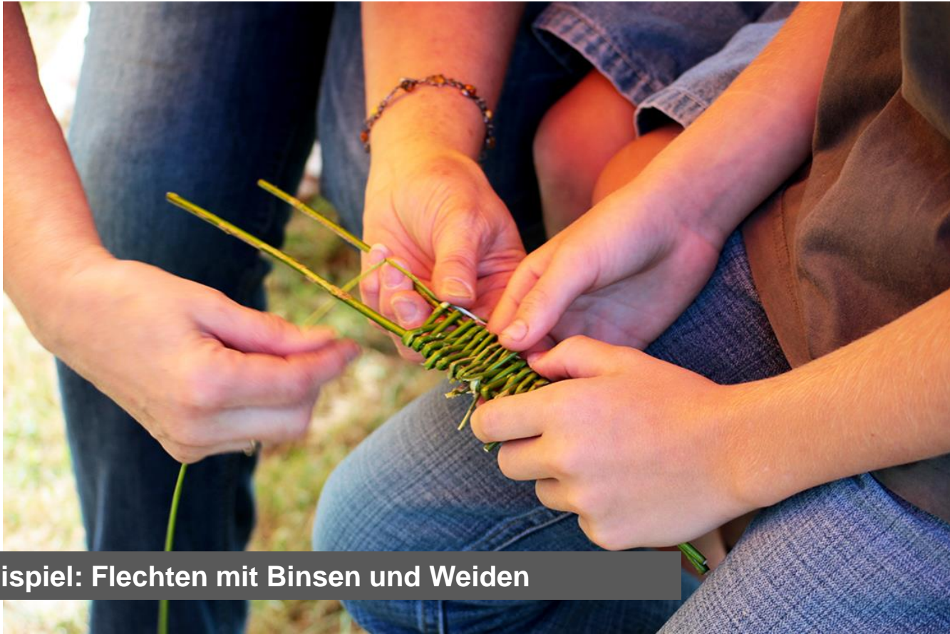
Beispiel: Flechten mit Binsen und Weiden