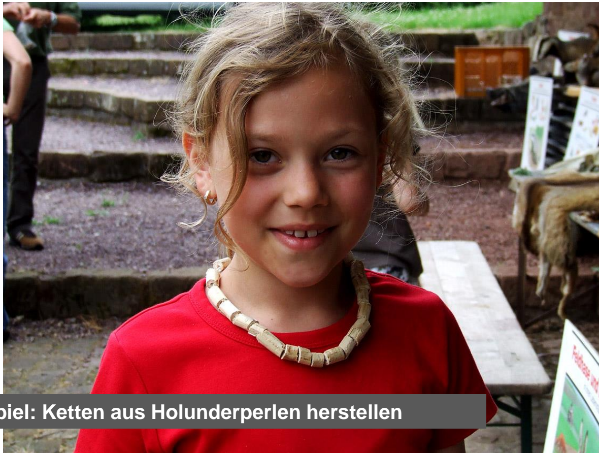
Beispiel: Ketten aus Holunderperlen herstellen