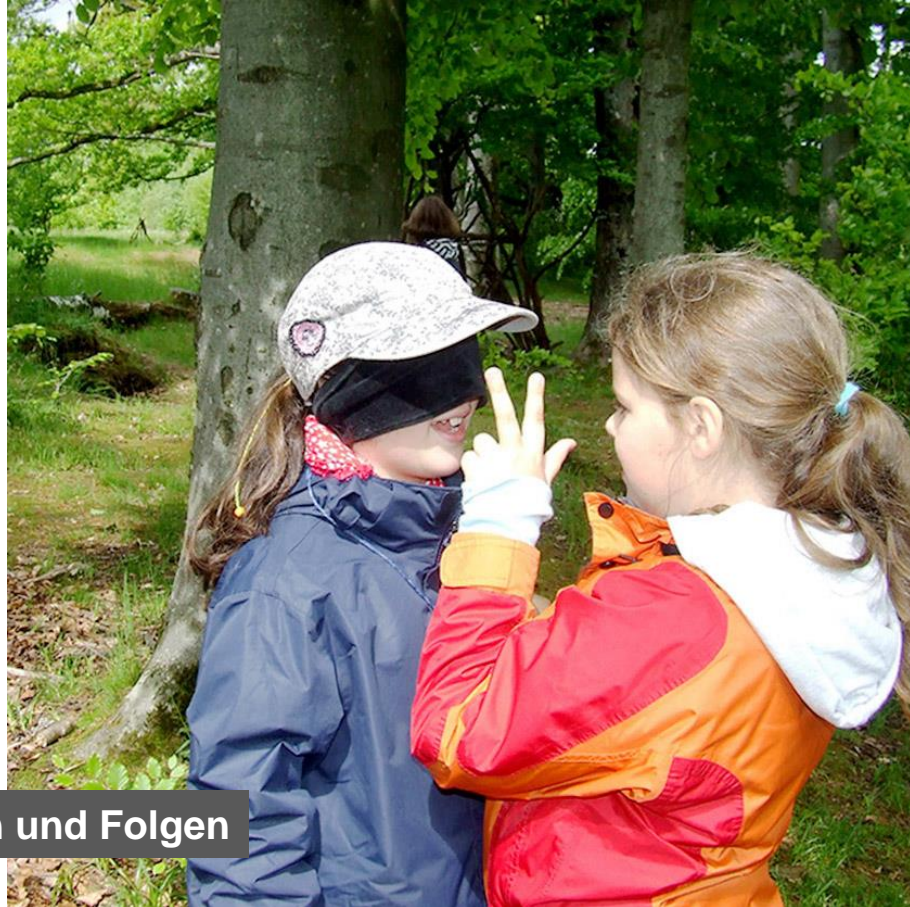
Führen und Folgen