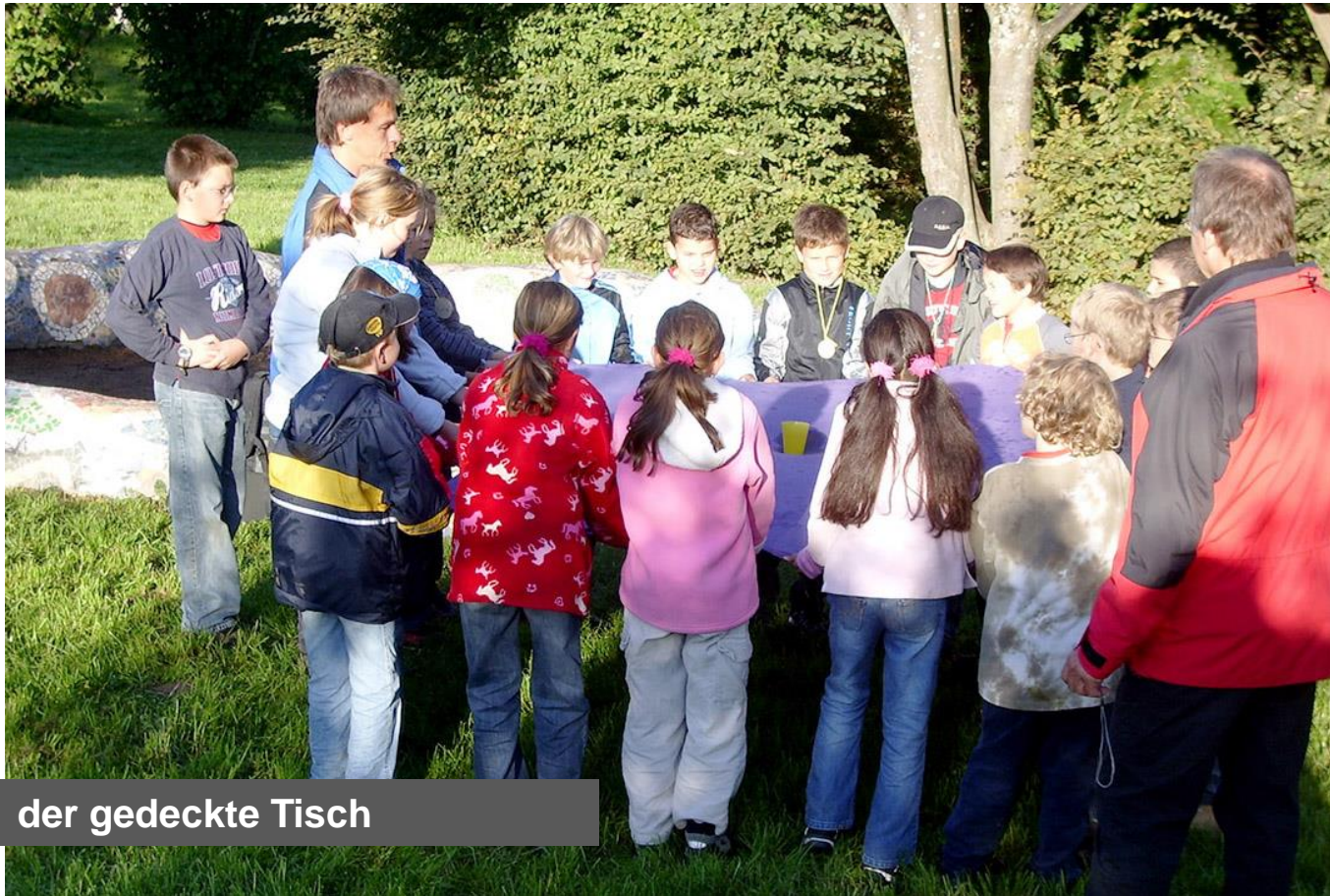
der gedeckte Tisch

Teilkompetenz: Mit anderen planen und handeln können